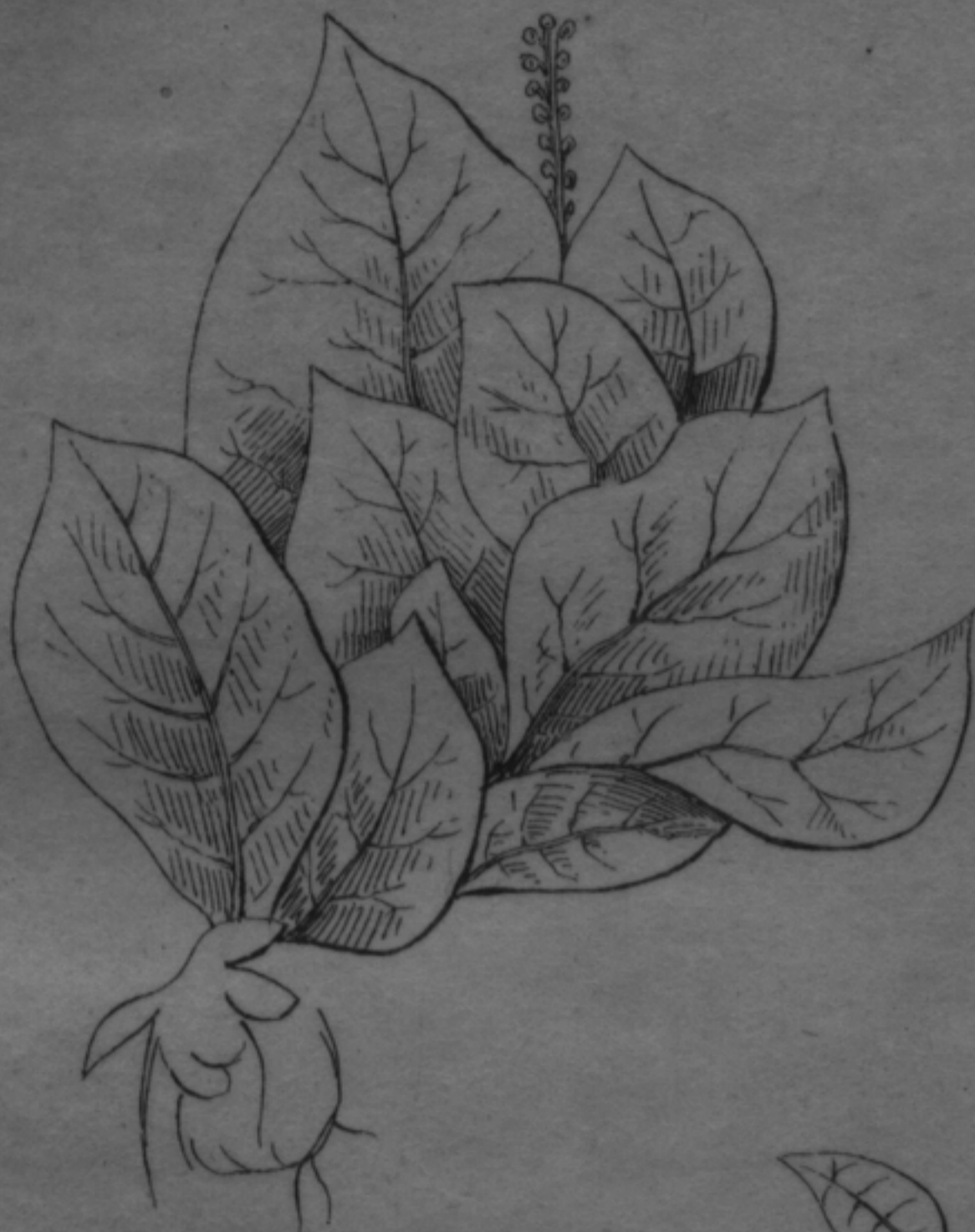
INDIAN TOBACCO PLANT IN BLOSSOM.