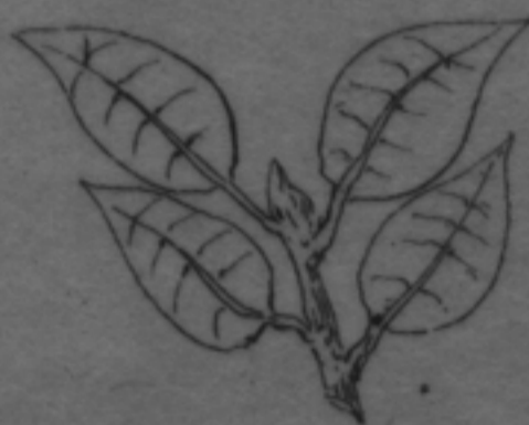
AMERICAN TOBACCO STALK AND LEAF.